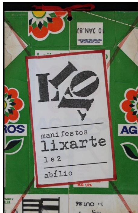
Figura 2: Manifestos “lixarte” 1 e 2 (frente), 1986. Reproduzido com permissão.

“realismo máximo”, é o próprio artista quem afirma, em texto já antes citado, que “a poesia visual está em toda a parte!... pronta-a-ler! feita por todos e pela natureza (cá por mim não me custa nada acreditar que se existisse algum deus também era capaz de dar uma ajuda)!... só é pena se ainda não é lida por todos livremente!” (Santos 1985a: 108). Ao modo de Alberto Caero, como evidencia Eunice Ribeiro (2014), testemunha o artista: “os poetas que mais admiro são o pão, a água, o olhar das crianças, uns seios de mulher, o vagabundear pelo porto, embalagens esmagadas pelo rodado dos carros contra o piso das ruas, o sol, a chuva, as árvores.” (Santos, 1985a: 108). Há evidentemente um toque de Álvaro de Campos também aqui, em particular na fricção dos rodados dos carros que esmagam embalagens contra ao chão.