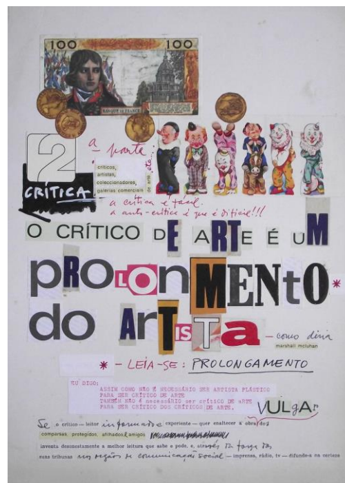
Figura 4: Segunda folha de (COLAGE)Manifesto Vermelho, 1976. Reproduzido com permissão.