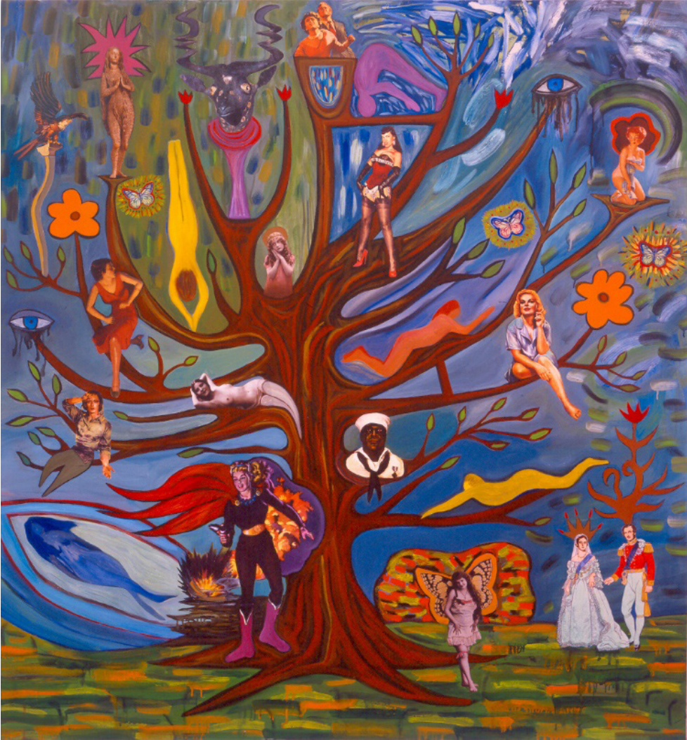
Susan Bee, Roots and Branches , 2004, 54" x 50", oil and collage on linen.