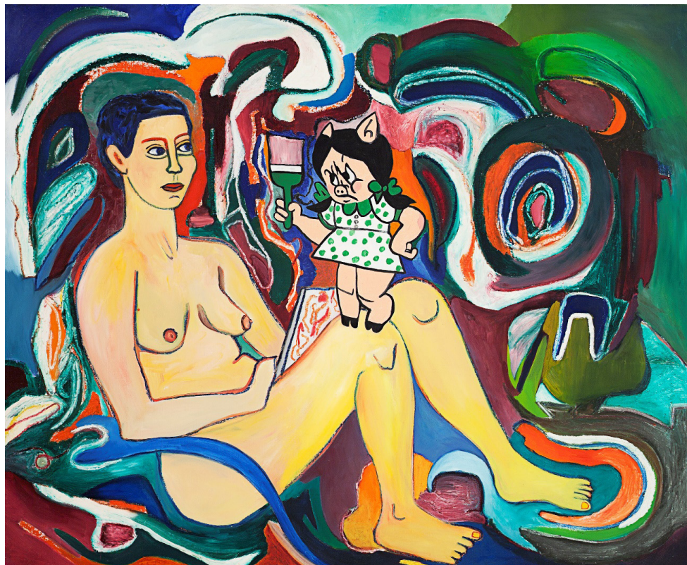
Susan Bee, Portrait of the Artist as a Young Pig , 1983, 50" x 60", oil on linen.