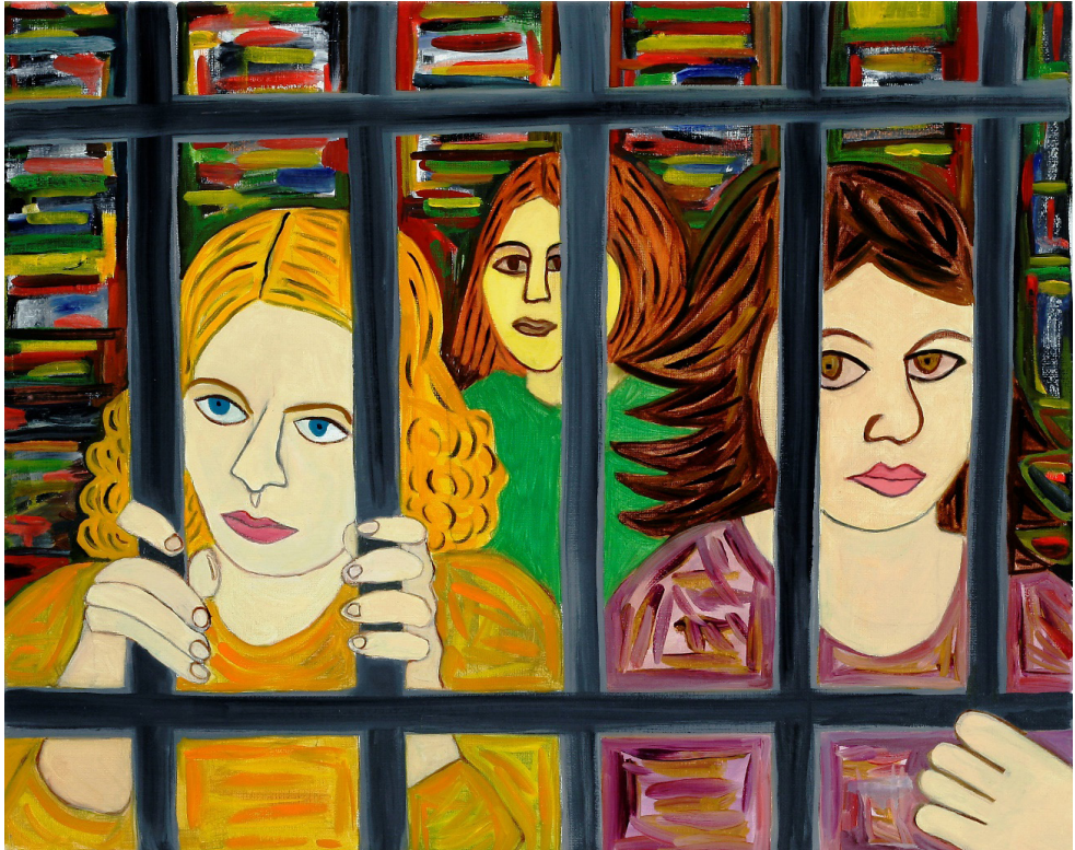
Susan Bee, Behind Bars , 2009, 16" x 20", oil on linen.