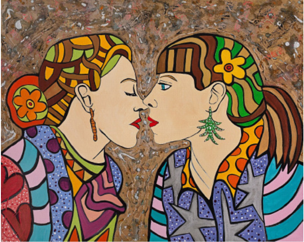
Susan Bee, Passion , 2016, 24" x 30", oil, enamel, and sand on linen.