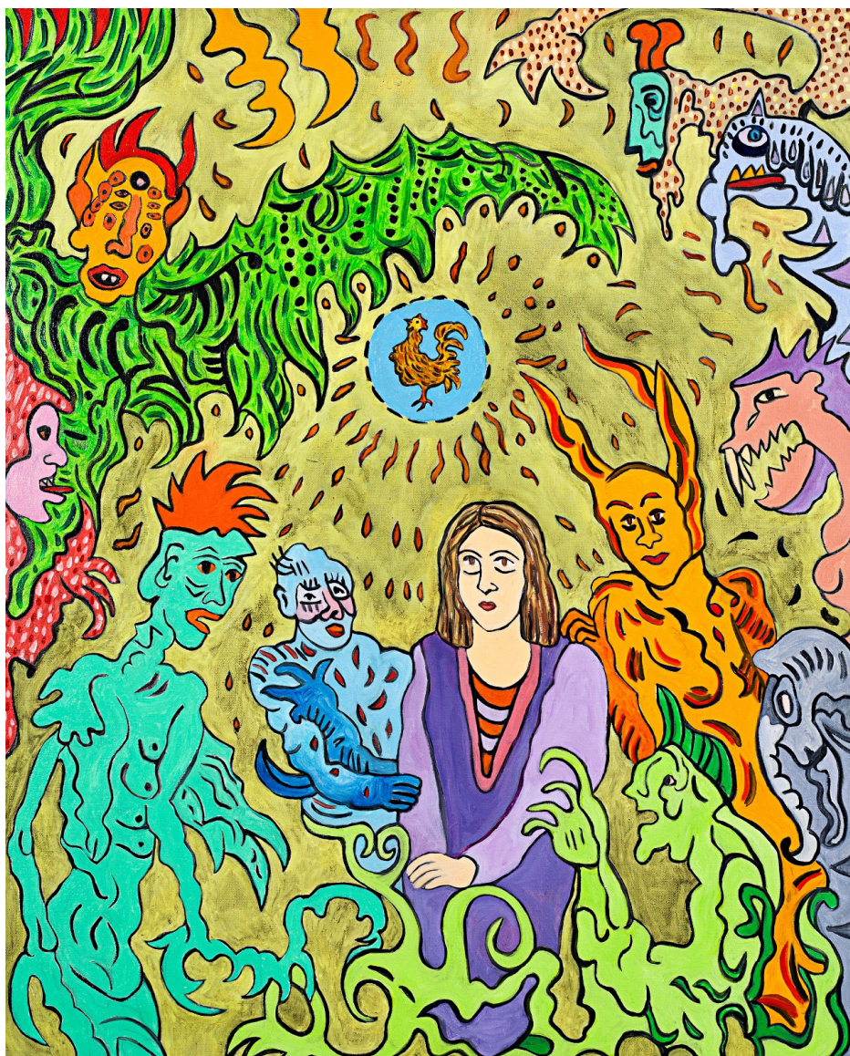
Susan Bee, Demonology , 2018, 30" x 24", oil on linen. Collection: Phong Bui