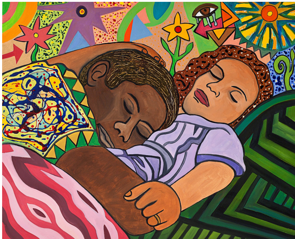
Susan Bee, Dreamers , 2014, 24” x 30”, oil and enamel on canvas.